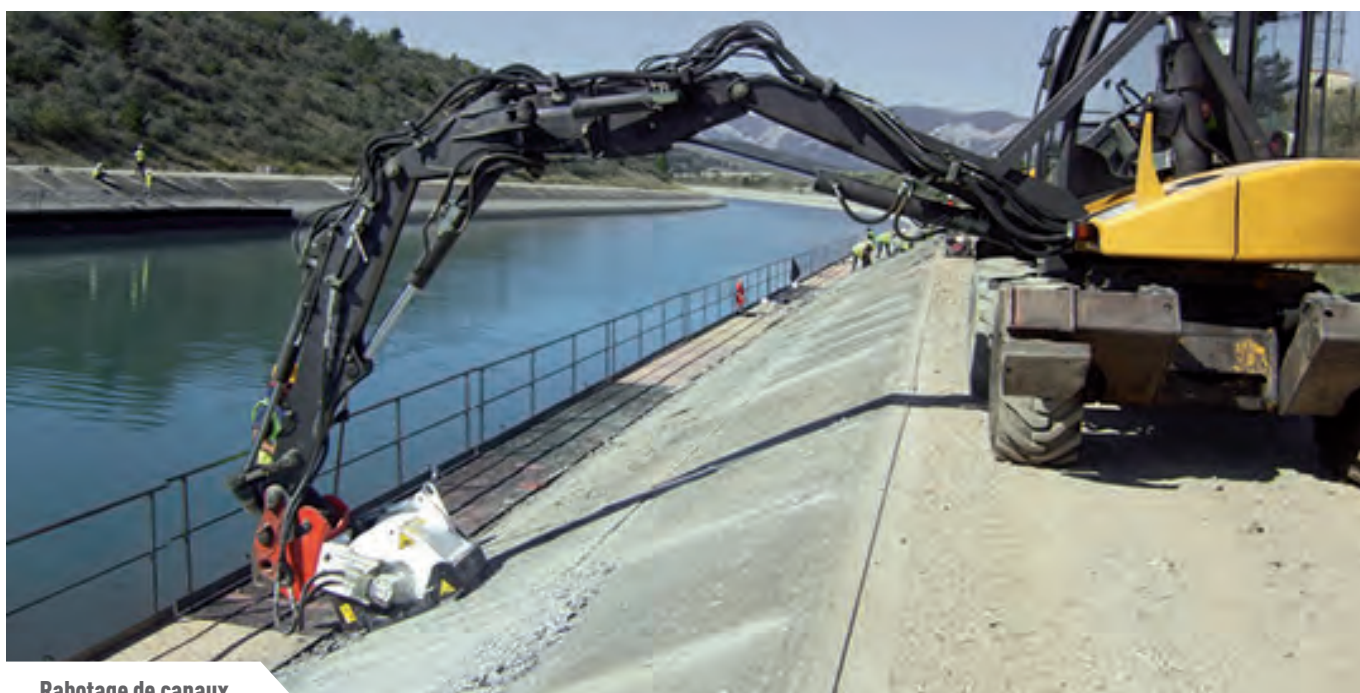
Rabotage de canaux