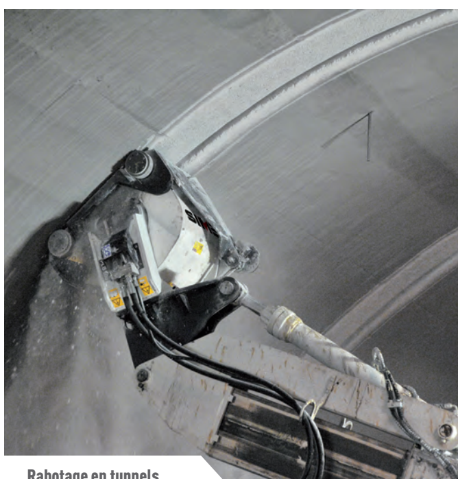
Rabotage en tunnels